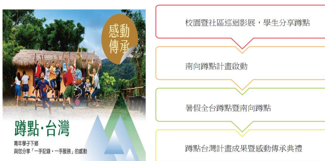
圖 2：『蹲點·台灣』計畫內容

此外，我們今年將持續舉辦蹲點台灣的校園巡迴影展，帶著參與蹲點的優秀同學到各個校園，透過同儕的分享，讓蹲點的感動和更多同學分享，今年預計全省巡迴 30 場講座。隨著蹲點台灣活動的越來成熟，我們在 2014 年導入的青年培力計畫也獲得很好的成果，所以今年將會持續舉辦青年培力工作坊，希望將這些參加過蹲點台灣的同學再聚集起來，透過相關課程的設計，讓這群曾經在蹲點活動表現出色的同學，再一次燃起生命的熱情，並提出自己的服務計畫書，由基金會提供資源與協助，讓他們完成自己的服務夢想。